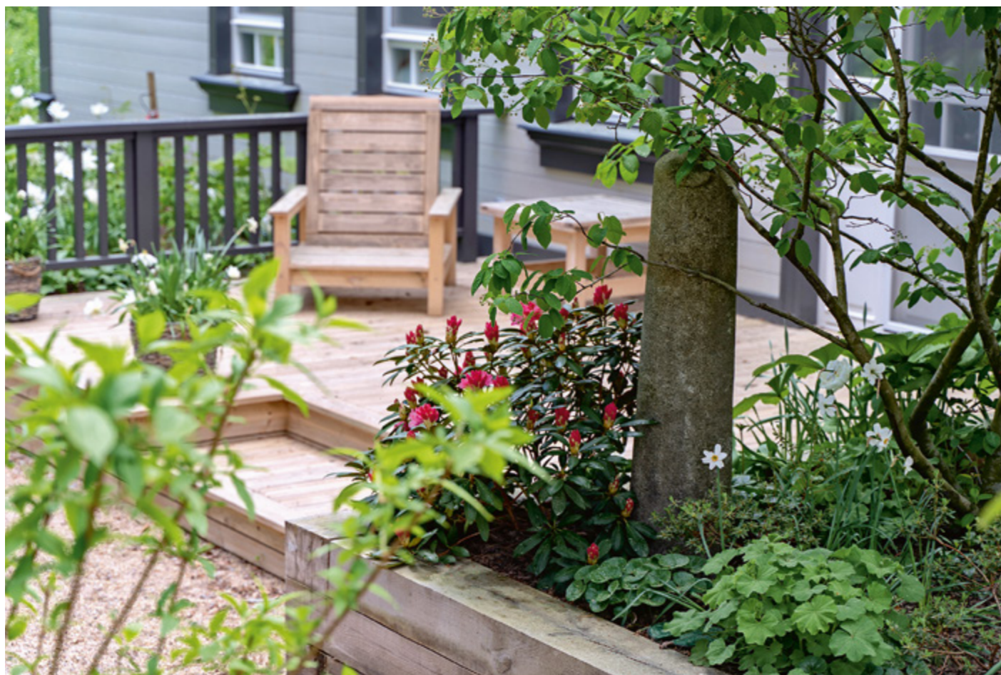
▲ Kā dekoratīvi elementi, kas dārzam piešķir pārļaicīgumu, izmantoti vairāki 250 gadu seni, sūnām apauguši pilsētas robežakmeņi.

Šai dārza daļā būtu visu dienu. Arī te zemi sedz grants, tomēr dārza raksturs ir pavisam cits – dobes un visu dārzu iezīmē no gulšņiem veidotas apmales un pakāpieni, uz kuriem var arī apsēsties un kuru veidotais reljefs piešķir dārzam dinamiku.