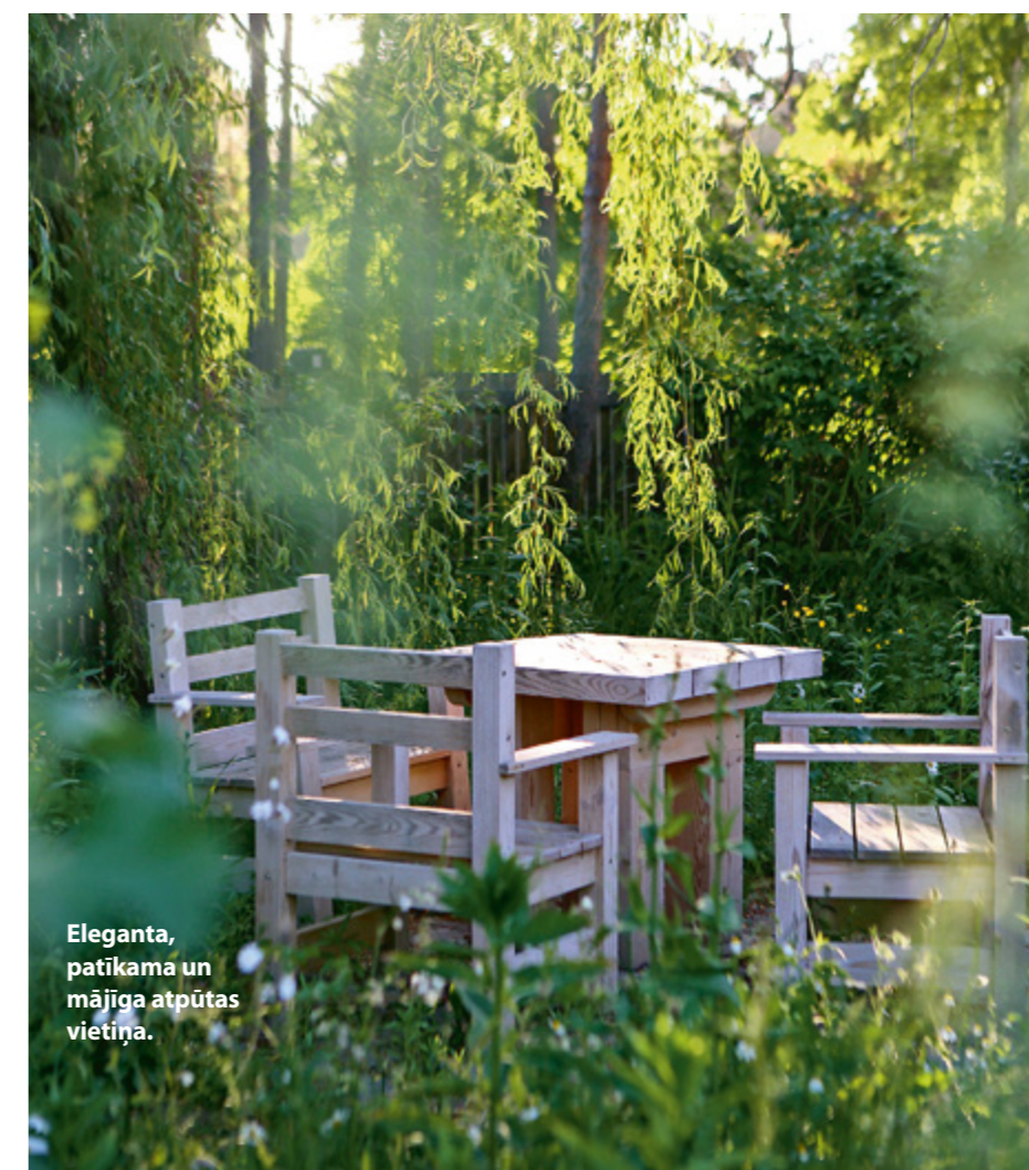
Eleganta, patīkama un mājīga atpūtas vietiņa.

No virtuves dārza neskartajā zonā ved dažus soļus gara taciņa. Tās likumā zem skaisti nokareniem sēru vītola zariem iekārtota mīlīga atpūtas vietiņa. Flīzes tajā speciāli klātas ar atstarpēm, lai pa vidū dabiski var iedzīvoties zāles un nezāles. Mēbeles izdomājis pats saimnieks, un meistari tās uztaisījuši no ēkas būvniecībā pāri palikušajiem kokmateriāliem. Tā tapuši arī pārējie dārza soliņi, kas ik uz soļa piedāvā iespēju piesēst un baudīt dārzu. JK