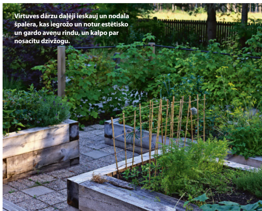
Virtuves dārzu daļēji ieskauj un nodala špalera, kas iegrožo un notur estētisko un gardo avenū rindu, un kalpo par nosacītu dzīvzogu.

Nenoteiktā rakstā izkārtotās divu veidu plāksnītes no 30–40 gadu senas pagātnes izpludina laika nogriezni. ♡