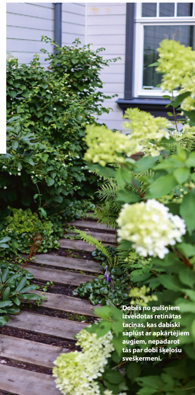
Dobēs no gulšņiem izveidotas retinātas taciņas, kas dabiski saplūst ar apkārtnējiem augiem, nepadarot tās par dobi šķeļošu svešķermeni.