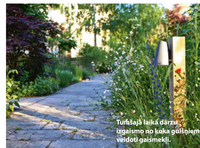
Turšajā laikā dārzu izgaismo no koka gulšņiem veidoti gaismekļi.

Pastaiga pa dārzu ir apvedusi apkārt mājai un noslēdzas turpat, kur sākusies, – priekšdārzā. ♡