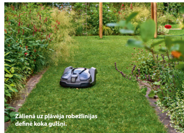
Zālienā uz pļāvēja robežlinijas definē koka gulšņi.

Dienvidu pusē iekārtotais iekšdārzs ir vienīgā dārza daļa ar labi koptu mauriņu. Tā robežas definē koka gulšņi, kas ne tikai estētiski iezīmē linijas, bet kalpo arī funkcionāli – lai robots, kas pļauj zālienu, var piekļūt tam līdz pašām malām. No priekšdienām te saglabāta liela kļava un neparasts kastanis ar daudziem stumbriem. Šai zonā ir arī divas plašas terases, no kurām baudāmas izteiksmīgas, nepārtraukti mainīgas, bagātīgas ziemcietīgu graudzāļu dobes ar zūmošām kāmēm un raibiem tauriņiem.