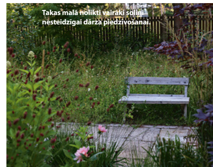
Takas malā nolikti vairāki soliņi nēsteidzīgai dārza piedzīvošanai.