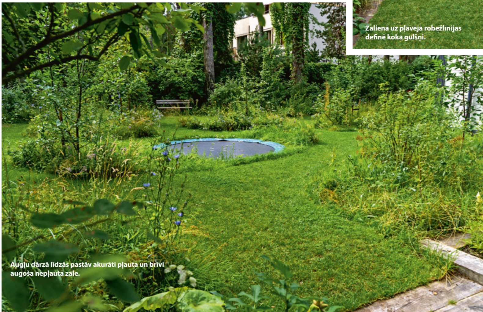
Augļu dārzā līdzās pastāv akurāti pļauta un brīvi augoša nepļauta zāle.

Pāris pakāpieni no iedziļinātā dārza, un jau esi augļu dārzā. Pa to ved izplautas taciņas, kurām pa vidu atstāti nepļautas pļavas fragmenti, apliecinot dabas klātbūtni. Tajos iestādīti augļu koki un ogulāji, kuru zaru vainagi ar laiku veidos izteiksmīgas telpiskas formas. Zemes līmenī zālājā iebūvēts batuts – bērniem drošāka, ar dārzu labāk saplūstoša un estētiskāka šī bērnu izpriecas versija. Augļu dārzu no nākamās zonas – iekšpagalma – nodala brīvas formas aroniju dzīvžogs.