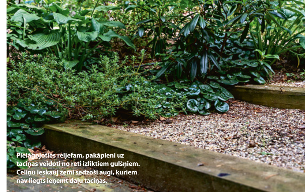
Pielāgojoties reljefam, pakāpieni uz taciņas veidoti no reti izliktiem gulšņiem. Celiņu ieskauj zemi sedzoši augi, kuriem nav liegts ieņemt daļu taciņas.

un punktveida stādījumiem gar ielu. Mežā izveidotas apmališu neierobežotas, brīvi plūstošas grantētas taciņas. To irdenais segums asociējas ar muižu parkiem un neprasa perfektumu – tai netraucē ne kāda izspraukusies nezāle, ne nokritusi lapa, čiekurs vai zariņš. Kopējai noskaņai tas piešķir dabisku dzīvīgumu bez stīvas pareizības. No taciņas uz ēkas pusi līdz pašai nama sienai veidots blīvs stādījums ar kupliem, ēncietīgiem augiem, jo šī ir ziemeļu puse, kuru saule nelutina. Te bagātīgi zied rododendri, bet rudenī – hortenzijas.